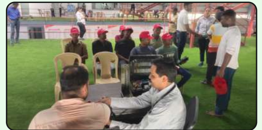
Medical Check up camp at MLL, Mora