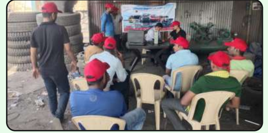
Medical Check up camp at MLL, Hazira