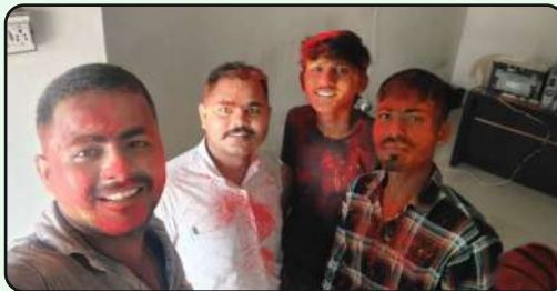
Holi Celebration at MLL, Gotan