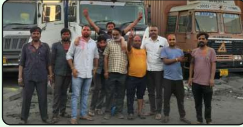
Holi Celebration at MLL, Dahej