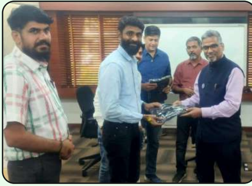
Mahindra Leadership Excellence Champion in West Zone