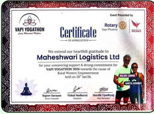
Certificate of appreciation for support in Yogathon