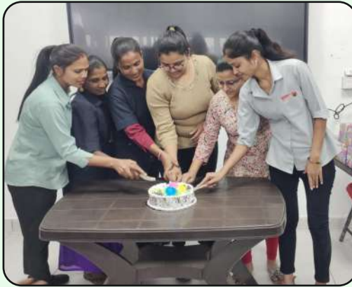
International Women's Day Celebration at MLL Mahindra Trucks and Buses, Mora