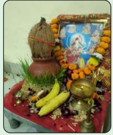
Diwali Poojan at MLL, Gandhidham