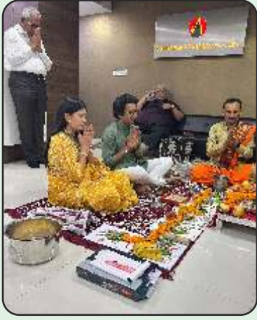
Diwali Poojan at Ahmedabad office