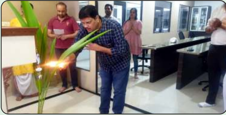
Navratri Pooja at MLL House, Vapi