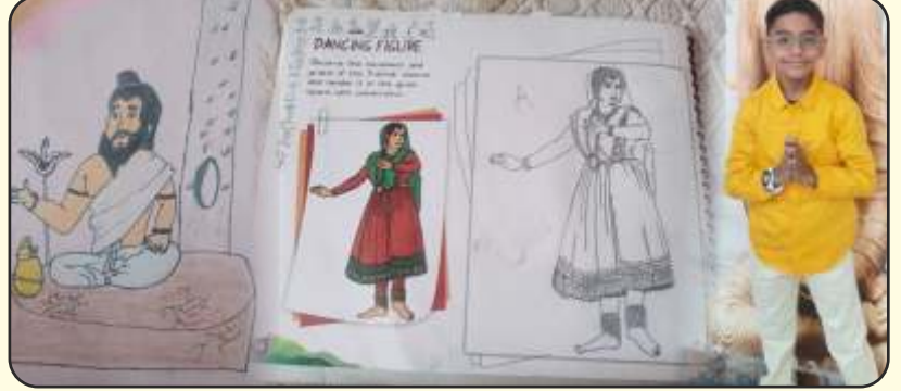
Sketches made by Arnav Maheshwari