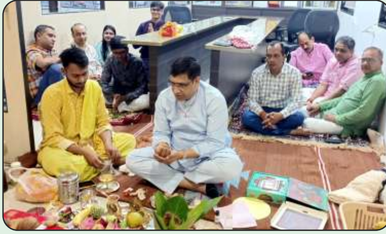
Diwali Poojan at MLL House, Vapi